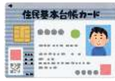
住民基本台帳カード